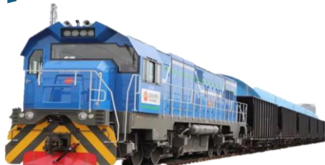
ТЕПЛОВОЗ маневровый гибридный