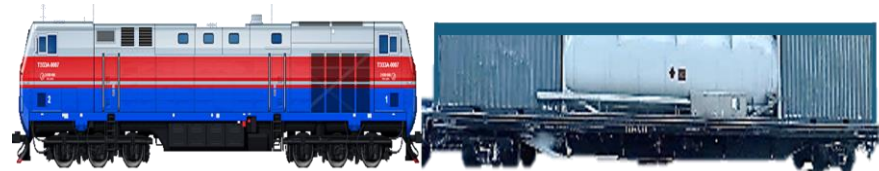
ТЕПЛОВОЗ на газомоторном топливе (СПГ)